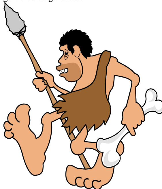
Un spécialiste de la pierre et des os

La journée prévoyant un petit crochet par Maffle (Ath) pour la visite du musée de la pierre, il y eut un os. Pas de guide ou de guidesse.