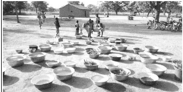
Les bassines attendent au soleil que les enfants aillent les remplir au puits 1

A la fin des travaux, pendant les jours précédant l'inauguration, les enfants ont déblayé, de la même façon, le surplus de sable qui restait devant l'école. Les bassines étaient parfois tellement lourdes (ils n'avaient