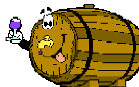
Repas du club