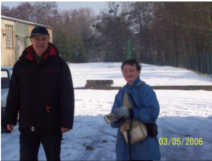
Au premier contrôle

Les premiers arrivés au lieu de rendez-vous ont eu droit à une représentation gratuite : difficulté pour les automobilistes à entrer dans le parking verglacé et à s'y frayer une place.