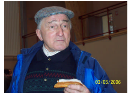
Il n'y avait pas que de la choucroute au menu.

A 13 heures, nous rejoignons le car qui va nous conduire à Sarreguemines. Cette ville doit son nom à la confluence des deux rivières, la Sarre et la Blies (le germanique "Gamundis" signifie "confluence"). La ville devient définitivement française en 1944 et montre donc une culture bivalente, à la fois germanique et romane.