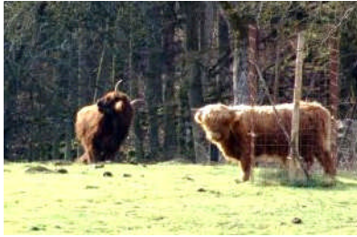
Celles-ci étaient à Mertert

A Beauraing, le car prend une petite route à gauche. Winenne est une jolie bourgade dont les maisons en pierre du pays, d'un beau gris bleu, montent à l'assaut d'une colline où trône une église dont les cloches égrènent neuf coups