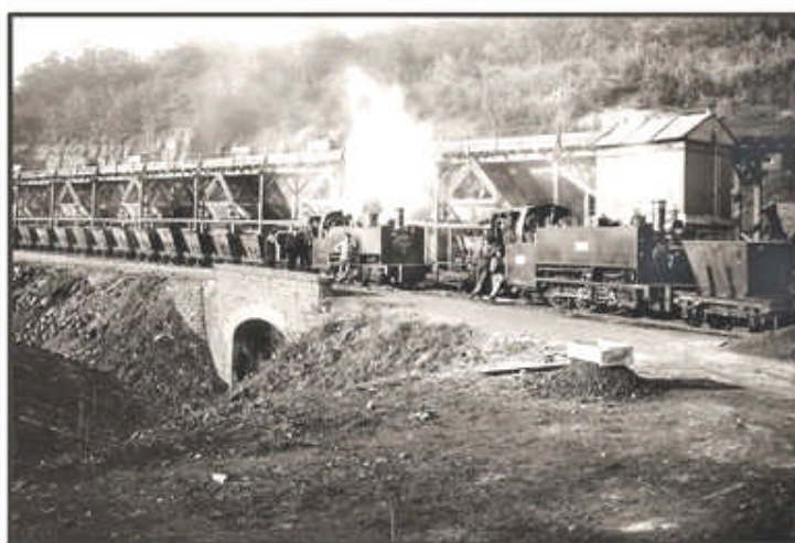
Exploitation minière à Lasauvage

On peut aussi prendre la « Minière's Bunn » (train utilisé dans l'exploitation minière) avec ses différents types de locomotives électriques: AEG et ARBED, ou encore ses locomotives diesel ou à vapeur, part à Fond-de-Gras, entre dans la galerie principale de la mine Doihl fermée en 1978 et sort