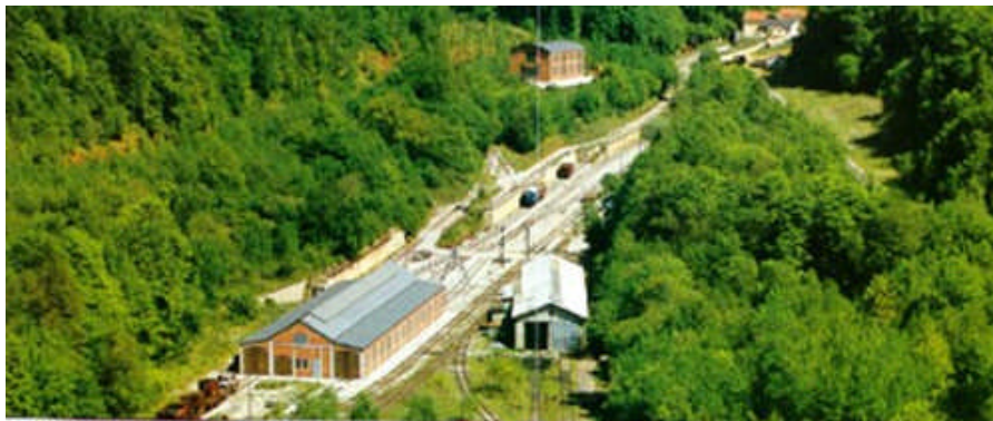
Le Fond-de-Gras de nos jours

Dans un cadre beau et tranquille où la nature a repris ses droits, on remonte aux origines de