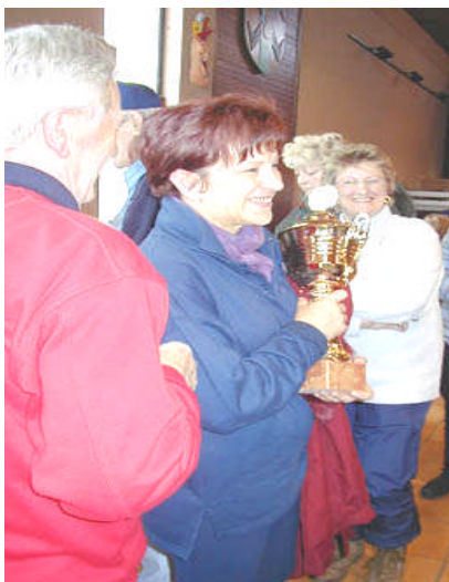
Une coupe bien méritée

Le lendemain, changement radical. Nous marchons à Moulins St Hubert, à la limite de la Meuse et de l'Ardenne. Après la "petite côte" annoncée par les organisateurs (5 km), nous descendons 5 km et sommes rentrés. Même si la température n'est pas clémente, le prin-