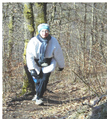
Vivement le sommet