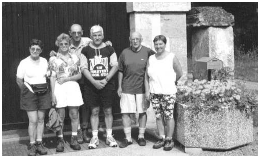
Le groupe à l'arrivée

Il mérite toute notre considération pour sa gentillesse et