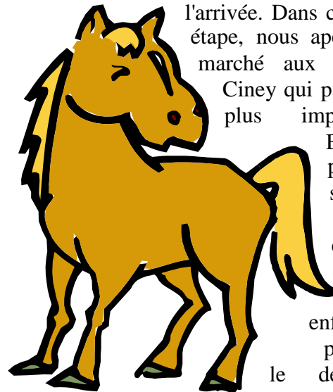
Un des malheureux poneys

Le second contrôle se situe dans une dépendance d'une ferme au lieu-dit "MASSOGNE" du celtique "mas" – beau ou haut et "ogne" – lieu. Le prochain contrôle est annoncé à 3,900 km plus loin. On repasse devant le parc au fond duquel se dresse le château de Massogne qu'on nous annonce comme datant de 1742. Pendant un temps, on craint à nouveau le supplice de boue mais l'alerte est de courte durée. Jusqu'à la fin, nous aurons un terrain convenable. De plus, la pluie a cessé. Voici maintenant l'hôtel de Surlémont où a lieu le troisième contrôle. Nous sommes à 2,100 km de l'arrivée. Dans cette dernière